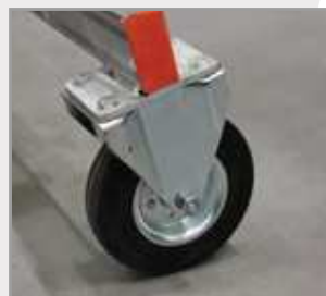
Rueda 150 mm