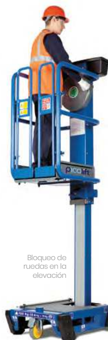
Bloqueo de ruedas en la elevación