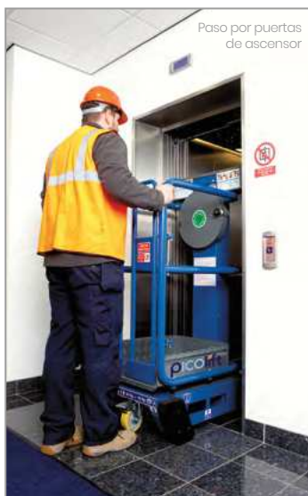
Paso por puertas de ascensor