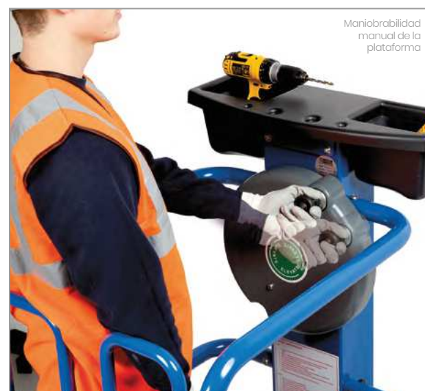
Maniobrabilidad manual de la plataforma