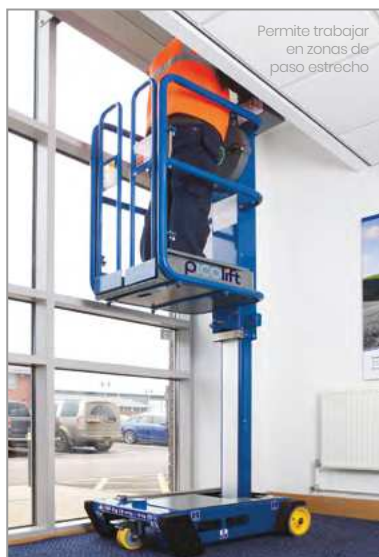
Permite trabajar en zonas de paso estrecho