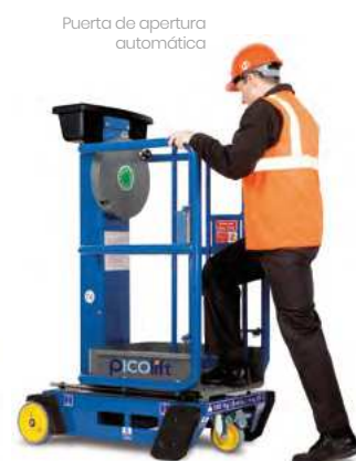
Puerta de apertura automática